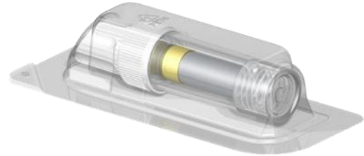
滅菌バリア2： ブリスター内のプラスチックバイアル