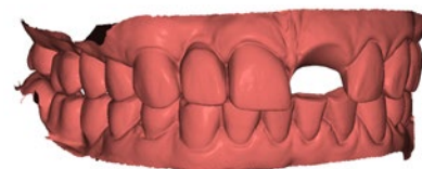
Visualización de los datos obtenidos con un escáner intraoral

Para obtener más información, consulta el manual de concepto NobelGuide.