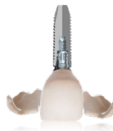
TempShell con pilar provisional Snap e implante de Nobel Biocare