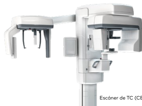
Escáner de TC (CB)

Separa los maxilares ligeramente con una placa de cera o una espátula de madera, con cuidado de no distorsionar la anatomía facial. Realiza un escaneo TC (CB) del paciente. La resolución recomendada y el tamaño de vóxel relacionado es de 0.5 mm máximo en todas las direcciones, típico 0.3 mm.