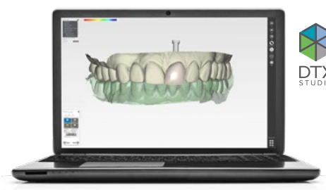
Software DTX Studio™ Lab