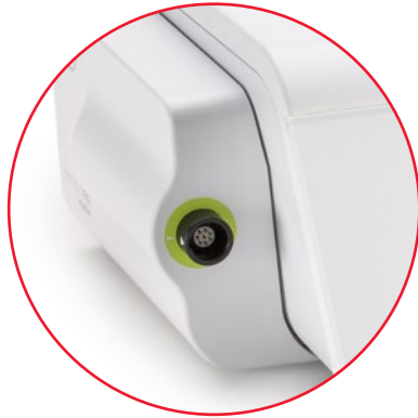
Módulo Osstell ISQ

El módulo Osstell ISQ utiliza análisis de frecuencia de resonancia (RFA) para determinar la estabilidad del implante y la osteointegración. El resultado se presenta como un valor ISQ de 1-100. Los valores e indicadores de estabilidad están basados en datos científicos. 1-7 El rango clínico de ISQ normalmente es de 55-80. Cuanto más alto es el ISQ, más estabilidad tiene el implante.